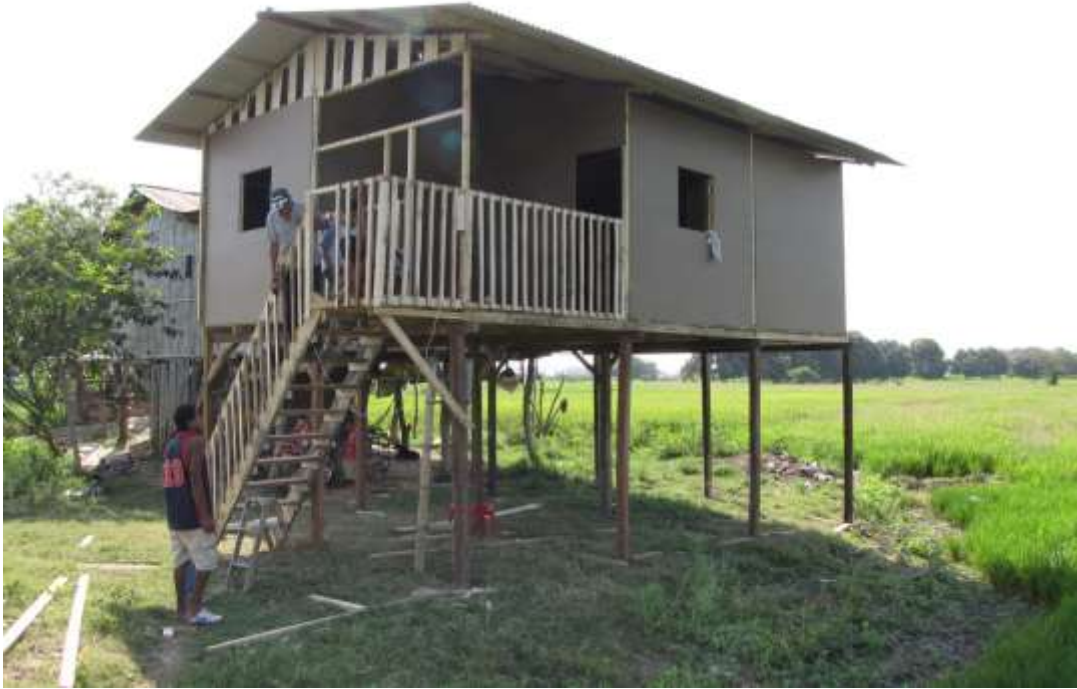
Foto real de la casa